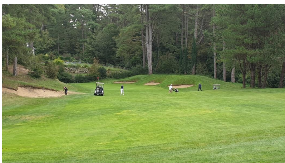
Parcours de la Mer au TOUQUET (27/09/23)

Comme à chaque numéro nous vous proposons quelques clichés pris lors de sorties amicales ou de compétitions des golfeurs du SCUF.