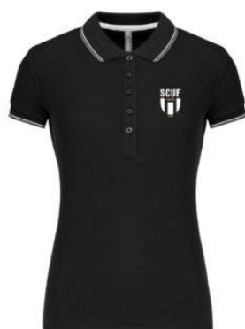
Polo coton piqué Femme