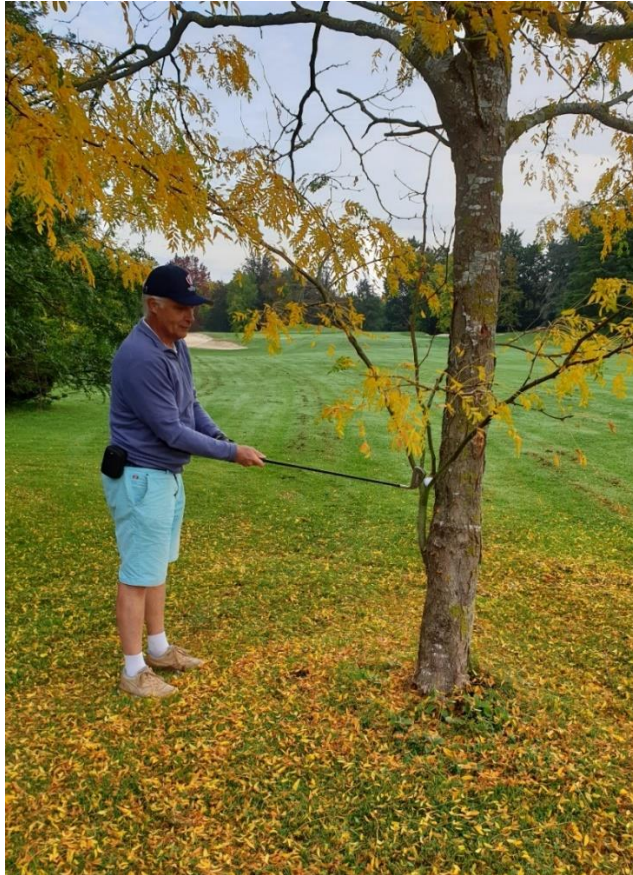
Joue-la comme Seve BALLESTEROS (Golf Parc Hersant 10.10.23)