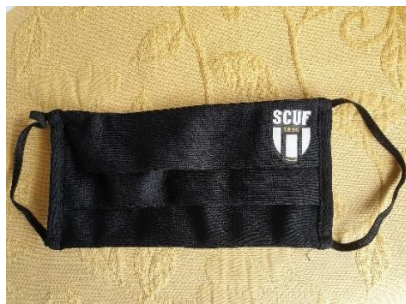
Masque (3 €)