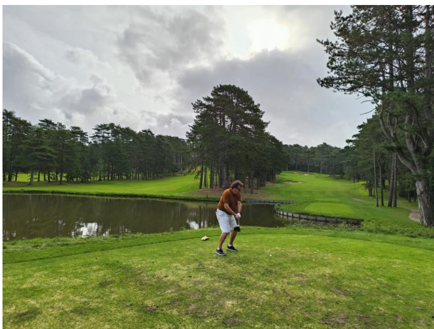
Départ des Dunes à HARDELOT (28/09/23)