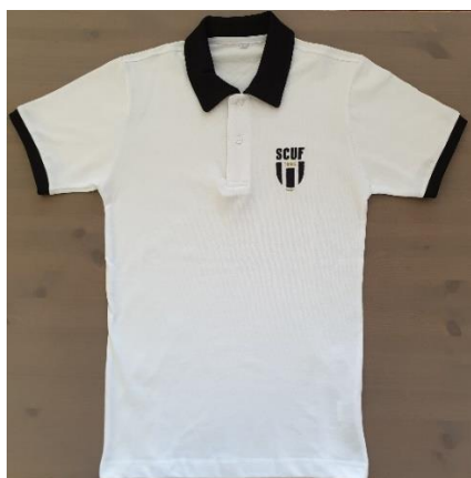
Polo de Golf (100% coton) (29 €)