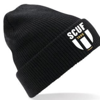
Bonnet coton noir