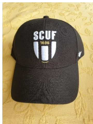
Casquette (24 €)

Pour acheter ces produits merci de contacter le bureau de la section : golf@scuf.org