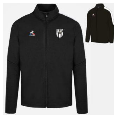
Veste coton Homme