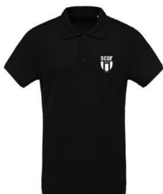
Polo coton piqué Homme

Ci-après quelques produits présents sur le site :